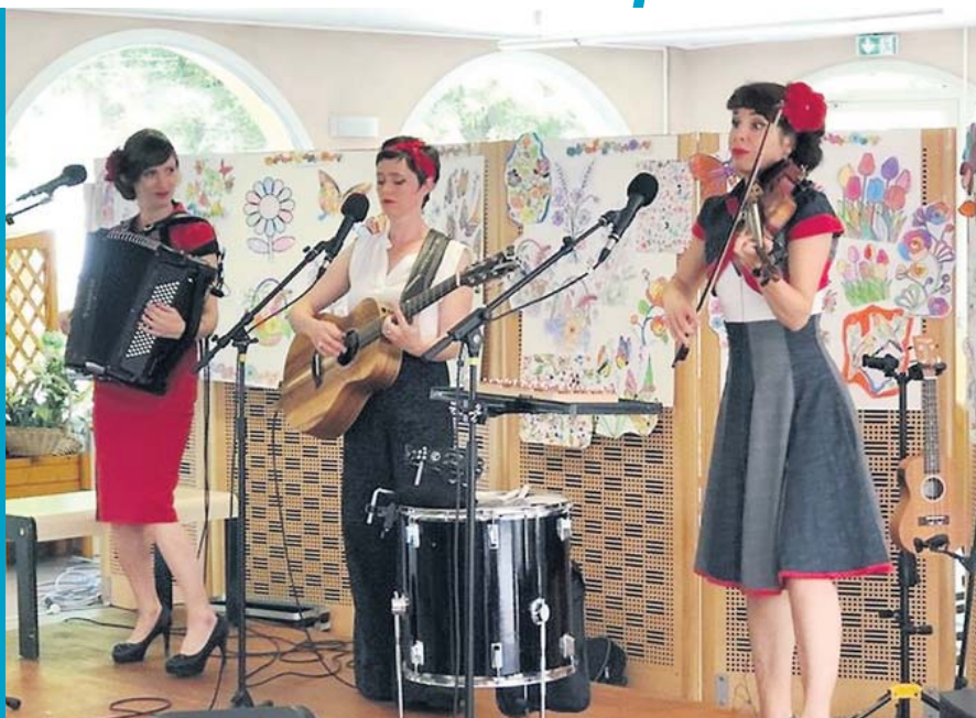
Le trio des Swingirls, hier à l'hôpital d'Agen puis devant les résidents de Pompeyrie : deux interventions auprès de publics « empêchés », qui ne pourront pas se rendre aujourd'hui et demain dans les salles ou bien dans la rue pour voir et écouter les artistes. Ce sont donc ces derniers qui sont allés à leur rencontre, un très beau geste.